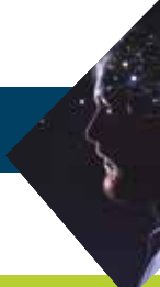
TAVOLA ROTONDA INAIL